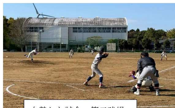
白熱した試合 第二球場