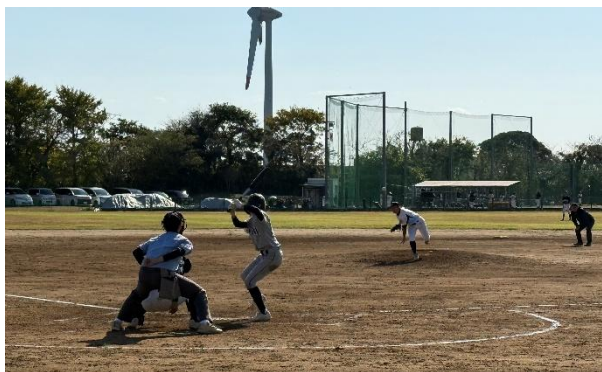
白熱した試合 黒潮かもめ球場